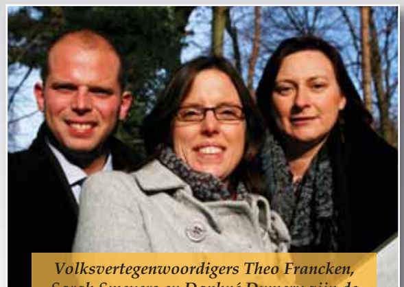
Volksvertegenwoordigers Theo Francken, Sarah Smeyers en Daphné Dumery zijn de N-VA-specialisten inzake asiel & migratie.

Voor N-VA-Kamerlid Daphné Dumery is het duidelijk: "Gezinsvorming en -hereniging, arbeids- en studentenmigratie, illegaliteit en regularisatie, vreemdelingen met tijdelijk verblijf, vrij verkeer van EU-burgers, erkende vluchtelingen, de verwerving van de nationaliteit ... elke schakel verdient een doordachte aanpak."