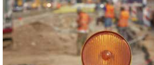
Lierbaan wordt vernieuwd p.3