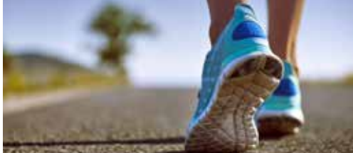
Loop jij mee een halve marathon? p.2