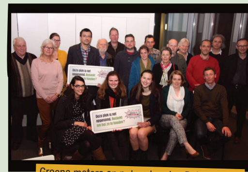
Groene meters en peters houden Putte proper.

Met sensibiliserende bemborden en affiches, een team enthousiaste groene peters en een vuilnisbakkenplan bindt het gemeentebestuur van Putte de strijd aan met zwerfvuil en sluijkstorten.