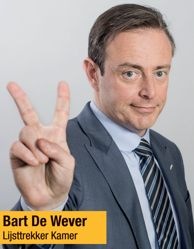
Bart De Wever Lijsttrekker Kamer