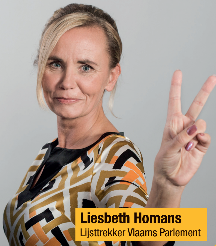
Liesbeth Homans Lijsttrekker Vlaams Parlement

Als burger, als vader en als burgervader zoek ik elke dag oplossingen voor het welzijn van iedereen die werkt, spaart en onderneemt. Maar zolang we België niet hervormen, staan we machteloos tegenover de hoge belastingen, de faillissementengolf, de verkwistende structuren.