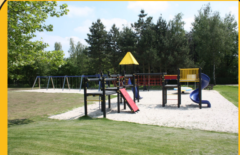
VERNIEUWD SPEELTERREIN GRASHEIDE De kleinsten onder ons kunnen zich naar hartenlust uitleven in een groen kader pal in het centrum van Grasheide.