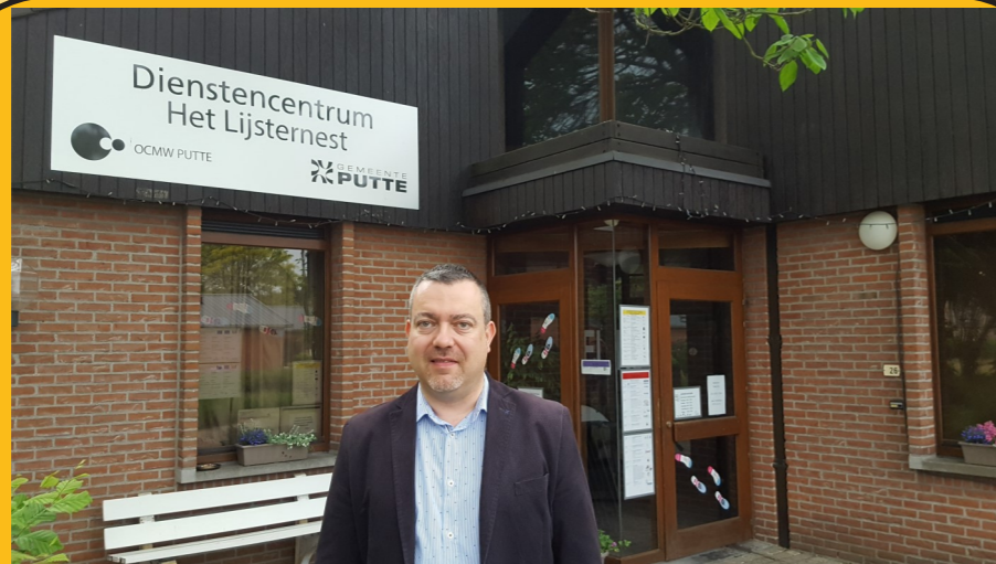
DIENSTENCENTRUM HET LIJSTERNEST Een ontmoetingsplaats met tal van activiteiten waar iedereen welkom is.