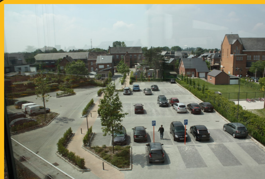
PARKING GEMEENTEPLEIN Een mooi plein in het centrum van Putte versterkt de handelskern en vormt een meerwaarde voor bewoners en bezoekers.

OMGEVINGSLOKET Verdere stappen in de digitale dienstverlening, nu ook online je bouwvraag indienen.