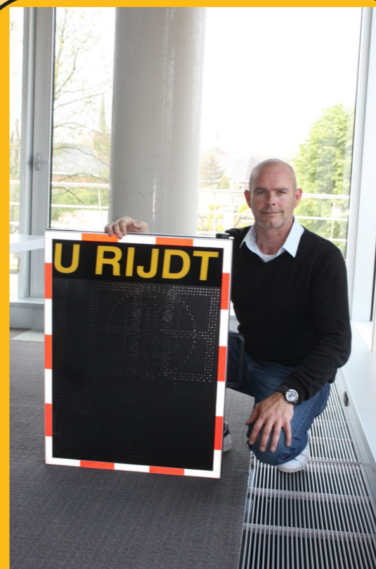
SMILEYS Verkeersveiligheid als prioriteit met snelheidsindicatietoestellen op alle verbindingswegen.