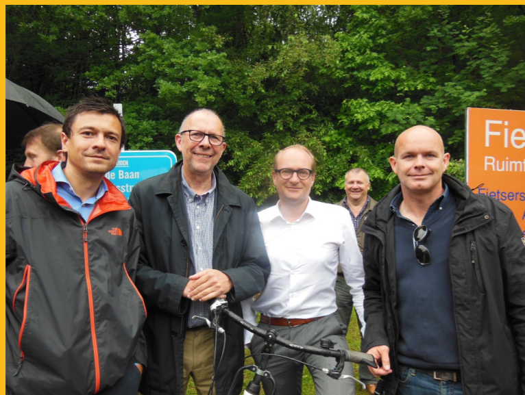
FIETSSTRAAT De langste fietsstraat in Europa (ism met Bonheiden en Mechelen) ter bevordering van een (veilig) fietsverkeer.

PUTTEBON Bevorderen van de lokale handelaars en horeca en een leuke cadeautip in één